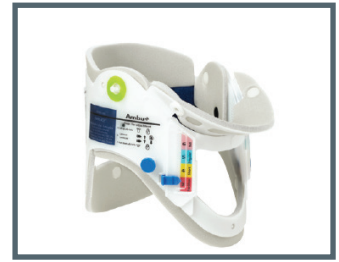
Ambu® Perfit ACE®