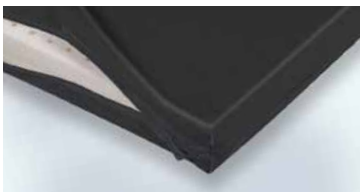
Bezug mit Reißverschluss