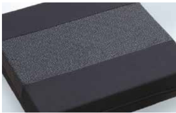
Mit AntiSlip-Ausstattung Bestellkürzel: -AS

*Für die Bestellung eines Verbundschaum-Kissens oder Bezugsvariante "AntiSlip-Ausstattung" die Bestell-Nr. um das jeweilige Kürzel ergänzen. Das Standard-Rollstuhlkissen in 3 cm Höhe ist nur in der Variante PU-Schaum erhältlich.